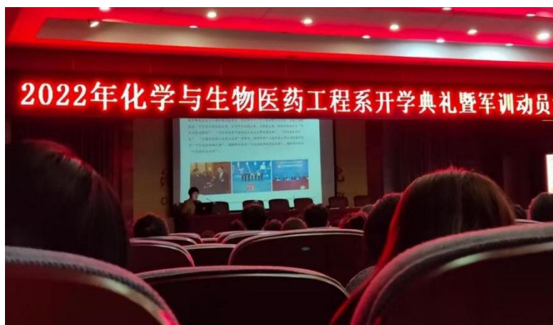
图1 河北建新化工有限公司人力资源部长到学校宣讲

河北建新化工股份有限公司连续多年与沧州职业技术学院化学与生物医药工程系合作，实行“2+1”教育模式，建立了稳定的学生顶岗实习合作关系，注重学生技能操作和综合素质的培养，使学生动手能力大大提高。经双向选择，学生可直接与实习企业签定劳动协议，实现了学生与企业的“零”接轨，拓展了学生就业渠道，走出了一条“以工养学，以学助工”的办学新路子。