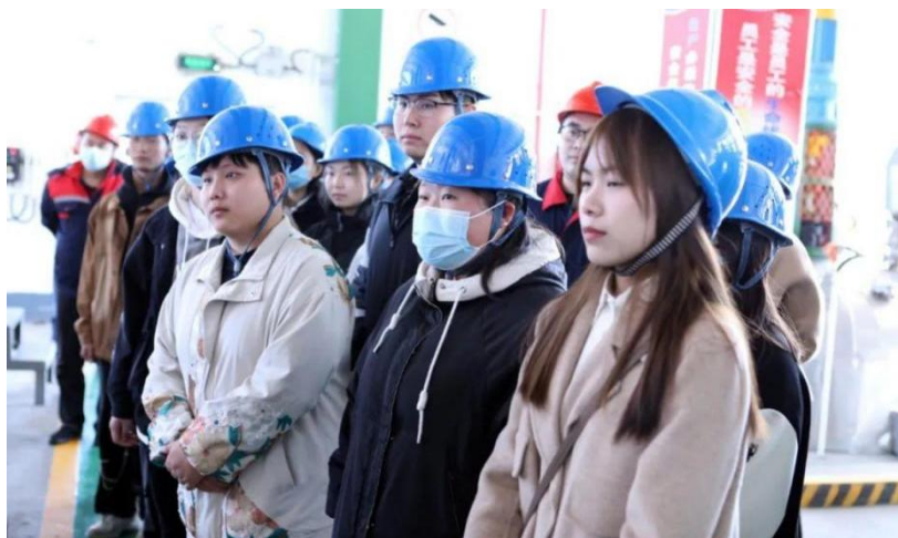
图5 学生到企业进行岗位实习

“借职院沃土，为建新蓄能。”这是“建新班”组建的宗旨，“建新班”自组建以来，校企双方严格按订单教育协议，认真执行双方共同核定的人才培养方案，已顺利完成在校期间人才培养任务，在这个阶段中订单班全体同学表现优异，专业技能、综合素质都有上佳的表现。每到毕业之际，被河北建新化工有限公司招聘的所有同学载着职院的厚望，带着自己的理想和公司的企盼，奔赴企业生产一线进行岗位实习，在实习中同学们需经过公司的各个岗位轮训，进一步提升了自已的职业能力和综合素质，并逐步成为了河北建新化工有限公司发展的中流砥柱。