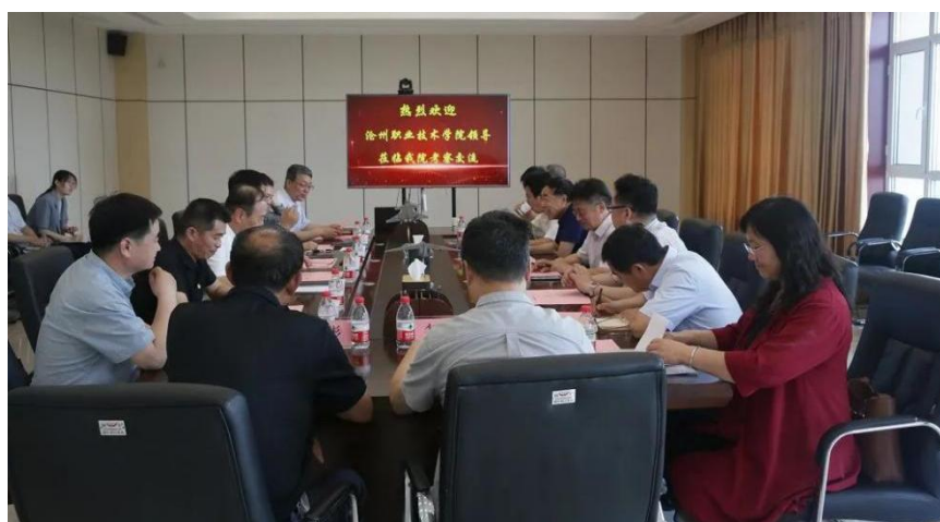
图3 校企双方就订单培养进行交流