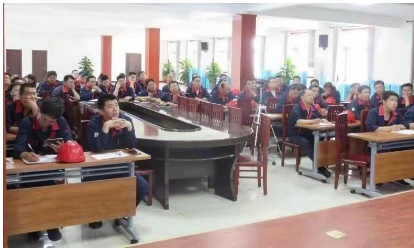
图 6 学院老师对企业职工进行培训

自双方开展合作以来，沧州职业技术学院充分利用专业优势和师资优势对河北建新化工有限公司职工进行培训，利用双方共同搭建的平台，对公司一线在职员工进行培训，发挥学员参与的积极性，既满足工作岗位上实用，也满足生活上实用，既有理论的提高，又要注重直接有效地解决工作和生活中的实际问题。