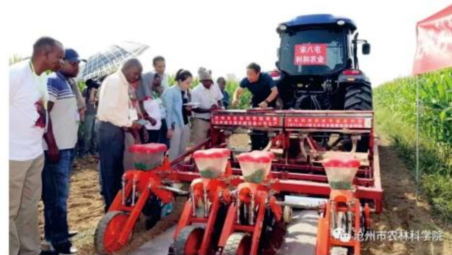
沧州市农林科学院

该项目获得发明专利、地方标准、计算机软著及学术论文和著作等多项知识产权。在应用推广中建立“科技创新+示范引领+农机研发+政府推广+媒体宣传”五位一体服务体系。2016-2020年累计应用面积1000余万亩,取得显著经济、社会和生态效益。